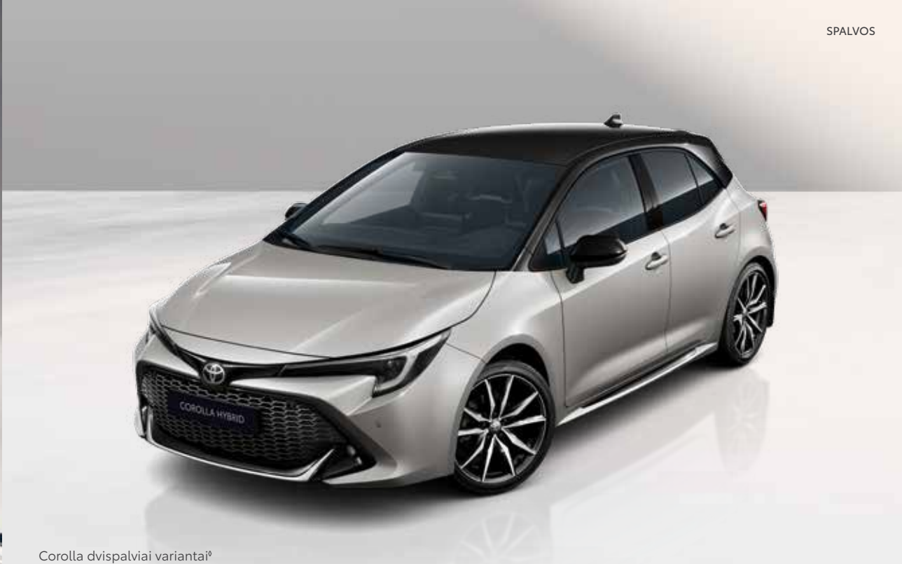
Corolla dvispalviai variantai 9