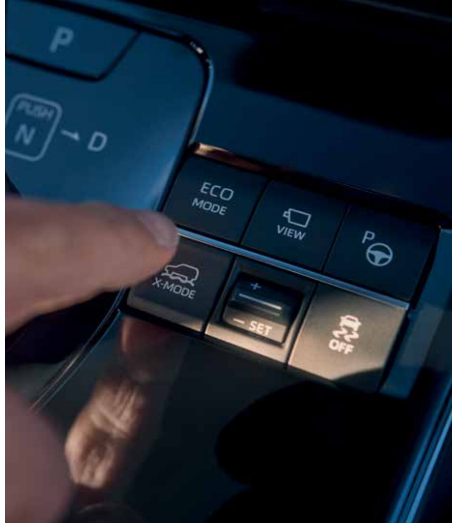
PASIRENGĖS BET KOKIEMS NUOTYKIAMS X-MODE padeda lengvai įveikti bet kokius vietovės ruožus.

Toyota bZ4X išsiskiria geriausia klasėje visų varomųjų ratų sistema – jos privalumais galite mėgautis bet koku oru. Naujas AWD X-MODE režimas užtikrina geresnes važiavimo savybes ir didesnę saugumą – dėl fantastiškų visų varomųjų ratų sistemos galimybių Toyota bZ4X gali įveikti bet kokius reljefo iššūkius. Toyota bZ4X sukurtas pranokti lūkesčius – jis sklandžiai važiuoja bet kokiomis kelio sąlygomis.