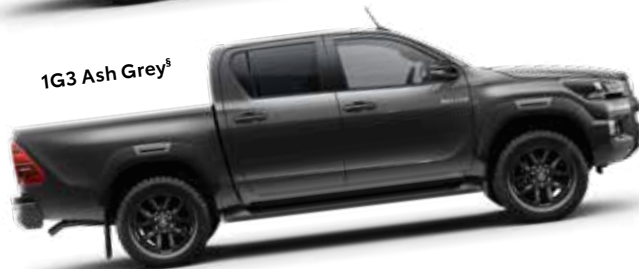
1G3 Ash Grey §