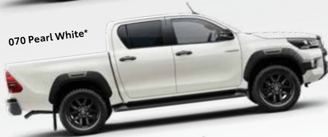
070 Pearl White*