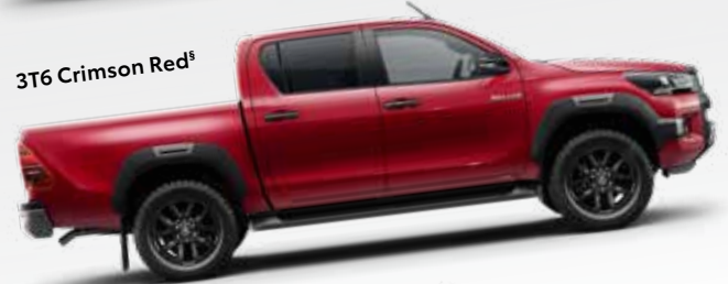
3T6 Crimson Red §