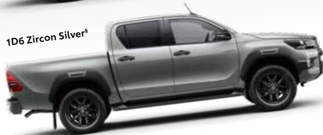
1D6 Zircon Silver §