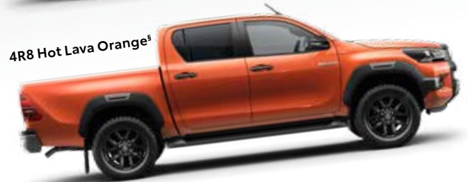
4R8 Hot Lava Orange §