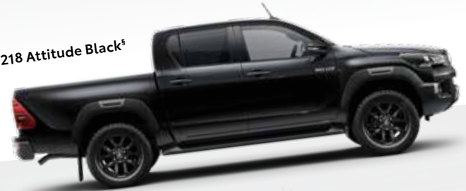
218 Attitude Black §